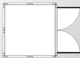
REF. MLB-2.4/2P 2360 x 2360 mm. Sup. Cons. 5,57 m 2 Sup. Útil 4,85 m 2