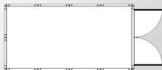
REF. MLB-4.5/2P 2360 x 4560 mm. Sup. Cons. 10,77 m 2 Sup. Útil 9,69 m 2